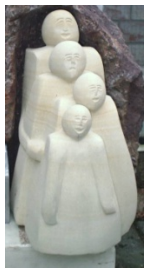
Das Gespenst 6

Die Skulpturen 1 und 2 sind aus der Ideenwelt des B. Brecht entstanden. Der Bildhauer Bodo Treichler aus Münster stand im Kontakt mit Manfred Wekwerth, dem berühmten Brecht-Schüler und ehemaligen Leiter des Berliner Ensembles. Es tauchte die Idee auf, aus fragmentarischen Szenen Brechts Skulpturen zu gestalten. Diese sind nun Teil des Bühnenbilds bei der Inszenierung des Theater in der Kreide 2014/15.